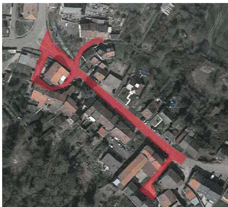
Rue d'Oudrenne - Métrich

Monsieur le Maire rappelle à l'assemblée que la commune envisage en 2022, de réaliser des travaux d'enfouissement de réseaux secs (réseaux Basse Tension, Eclairage Public et Orange) à Métrich au niveau de la rue d'Oudrenne, comprenant 30 branchements sur une longueur de 300 ml. Le coût estimatif du projet s'élève à 240 000 € HT